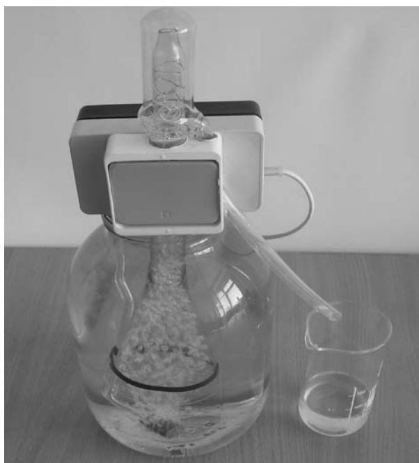
Рис. 1. Общий вид лабораторной установки

ся подачей воздуха микрокомпрессором и зависит от пленкообразующих свойств очищаемой воды.