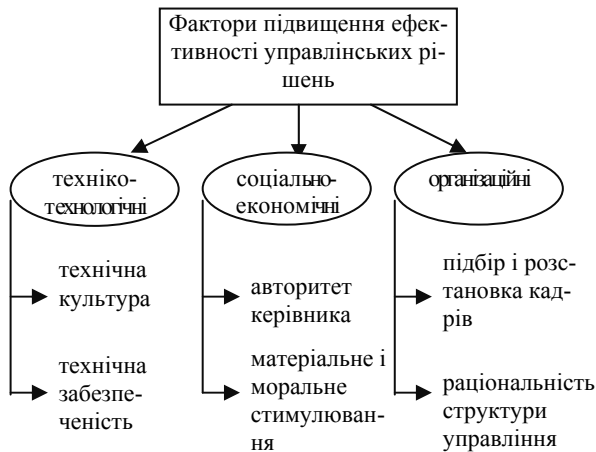
Рис.2 Фактори підвищення ефективності управлінських рішень

До організаційних чинників: ступінь раціональності структури апарату управління, стан розподілу і кооперації праці, підбір і розстановка кадрів, організація виконання, організація робочих місць, раціональність використання робочого часу [10].