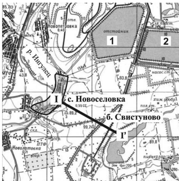
Рис. 1. Обзорная карта района исследований. М 1:100000. 1, 2 – отстойники ЮГОКа Войково и Объединенное, соответственно

Подобная ситуация в районах расположения накопителей и отстойников шахтных вод характерна и для Западного Донбасса. Отличием является лишь диапазон минерализации сбрасываемых вод – от 5 до 15 г/л [2].