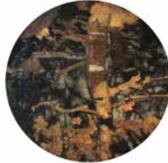
Рис. 3. Карбонатизация хризотил-асбестового прожилка в хризотил-антигоритовом серпентините. Свет проходящий, николи +, ув. 135*

рофотография карбонатизированного хризотилового прожилка в хризотил-антигоритовом серпентините. Отмечается избирательное замещение карбонатом прожилков хризотила на фоне основной породообразующей массы существенно антигоритового состава.