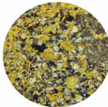
Рис. 2. Лиственит-березит по риолиту (КЗКС), николи +, ув. 200*

пиритом. Наблюдается развитие кварца двух генераций: исходного, породообразующего и выщелоченного, переотложенного в тенях давления вокруг карбоната и пирита. Таким образом, парагенезис серицит + анкерит + пирит + кварц (двух генераций) можно считать типоморфным для внутренних зон лиственит-березитов по кислым породам в ряде ЗКС Среднеприднепровского мегаблока (Сурской, Конкской и Белозерской).